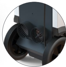
AD 935 S mit 1kW elektrischem Heizelement und 2x Ø100 mm Schlauchanschlüssen