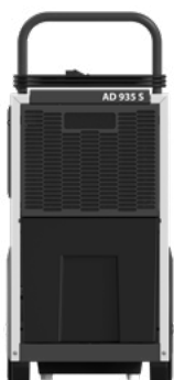
AD 935 S

Die AD 9-Serie ist eine innovative Technologie im Bereich der Kondensationsentfeuchtung, die hochmoderne Leistungsmerkmale mit maßgeschneiderten und umweltfreundlichen Lösungen kombiniert. Die Kondensationsentfeuchter der AD 9-Serie zeichnen sich durch ein standardisiertes und bewährtes Design in Kombination mit einem benutzerfreundlichen CC6-Bedienfeld aus, das eine drahtlose Verbindung mit dem Fernüberwachungssystem Simplify der Dantherm Group ermöglicht. Die auf Langlebigkeit ausgelegte AD 9-Serie vereinfacht die Wartung und gewährleistet reibungslosen Betrieb in verschiedenen professionellen Trocknungsanwendungen.